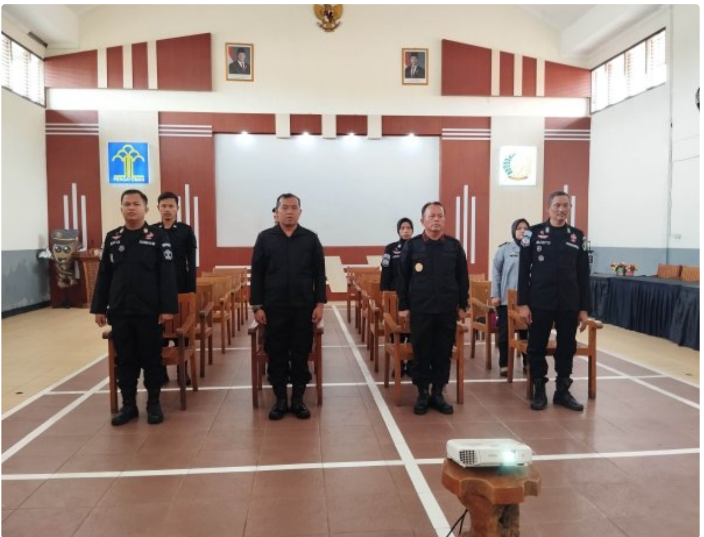
Blora - Rumah Tahanan Negara (Rutan) Kelas IIB Blora mengikuti rangkaian